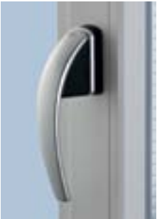
Ручка Roto Swing с врезным основным запором