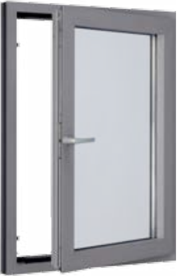
Алюминиевое окно с фурнитурой Roto AluVision Designo и скрытыми петлями

Roto AluVision Designo базируется на системе фурнитуры AluVision T 540-10, благодаря чему сокращаются складские запасы, что ведет к снижению затрат. Нижняя петля на раме сконструированна так, что нет необходимости в дополнительной обработке профиля. Все элементы петли как на раме, так и на створке крепятся на клеммах, что облегчает монтаж и сокращает временные ресурсы. Кроме того, последующая регулировка петель максимально удобна: фурнитуру Roto AluVision Designo можно смонтировать и отрегулировать при помощи всего 2 ключей. Преимущества для потребителей: интегрированные в петли смазочные приспособления обеспечивают постоянную и продолжительную по времени смазку, что снижает износ, повышает долговечность и значительно уменьшает работы по техническому обслуживанию.