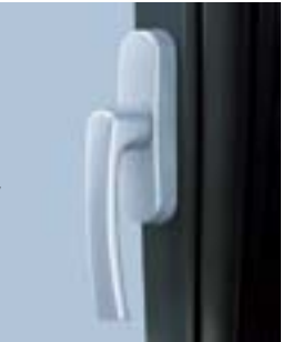
Roto Line, накладная ручка