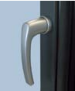
Врезной основной запор с ручкой без розетки