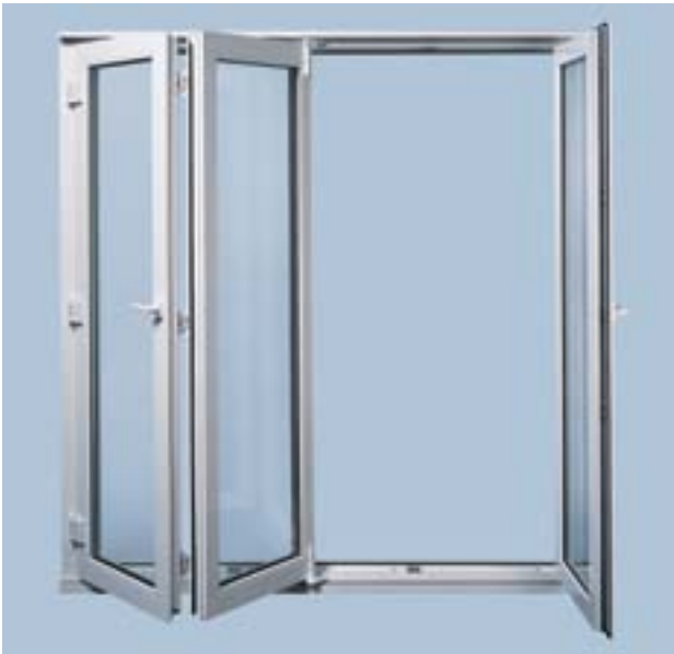
Alu Vision Patio Fold с установленной поворотно-откидной створкой.

AluVision Patio 160 S идеально подходит для окон и дверей, которые должны открываться полностью и при этом не занимать много места, особенно в школах, больницах, офисах, а также при проектировании террас и зимних садов. Благодаря плотному запиранию эта система обладает первоклассной звуко- и теплоизоляцией. Большим преимуществом является использование стандартных профилей для створок и рам. Сдвижной механизм обладает легким ходом и изнашивается незначительно. Система AluVision Patio 160 S может быть дооснащена противозломными элементами. Возможно изготовление наклонно-раздвижных систем шириной от 630 до 1680 мм и высотой от 930 до 2330 мм. В штапеловом исполнении ширина прохода может достигать 3300 мм.