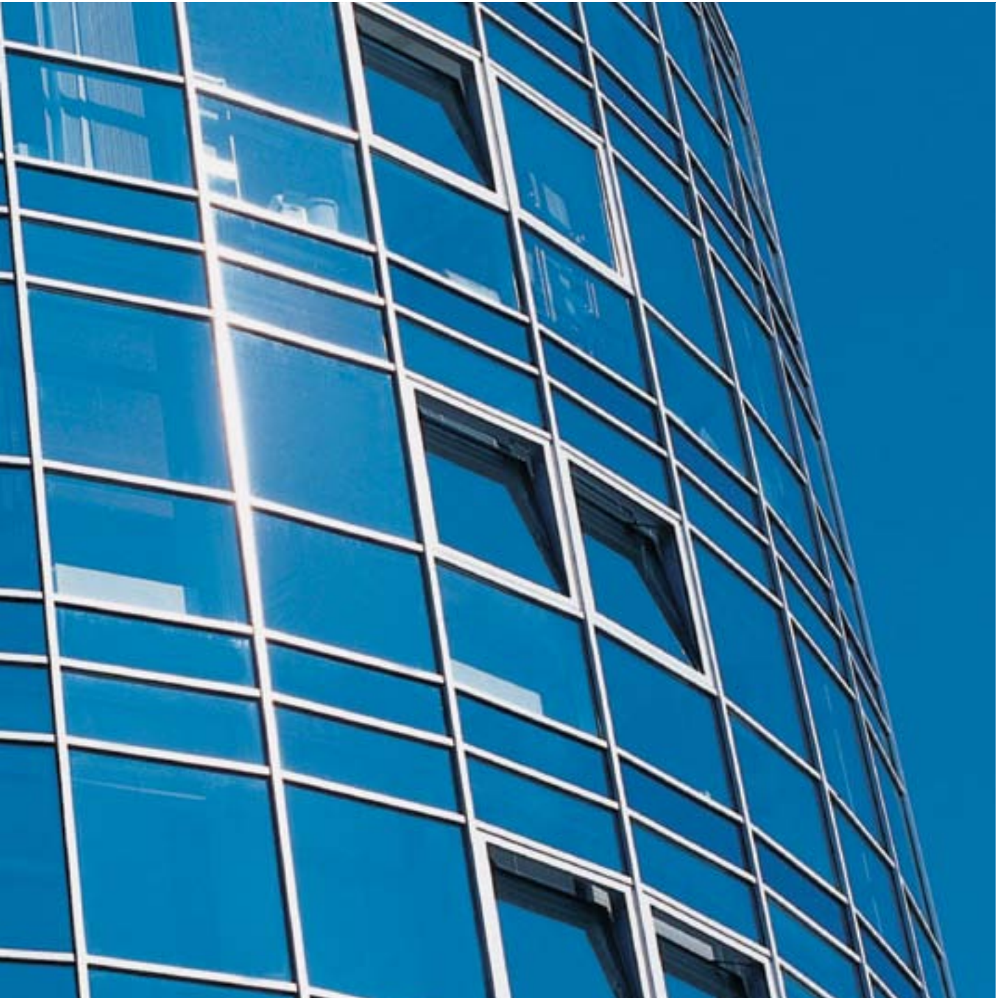
Roto Alu Vision