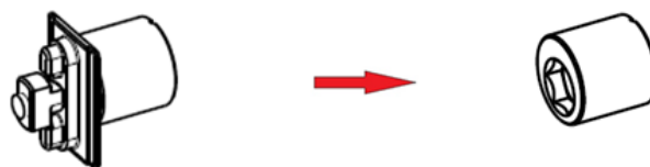
Rys. 4 Zmiana w zestawie 812038 -> 86110