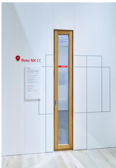
Foto: Roto Frank Fenster- und Türtechnologie Roto_Patio_Inowa_Max_Frontale_2024.jpg

La „Fensterbau Frontale”, vizitatorii au putut să se familiarizeze, printre altele, cu gama variată de balamale din programul de feronerie oscilo-batantă „Roto NX” pentru ferestre din toate materialele de profil. Balamaua modernă, complet ascunsă „Roto NX | C” pentru ferestre din PVC și lemn va fi disponibilă în curând în întreaga lume.