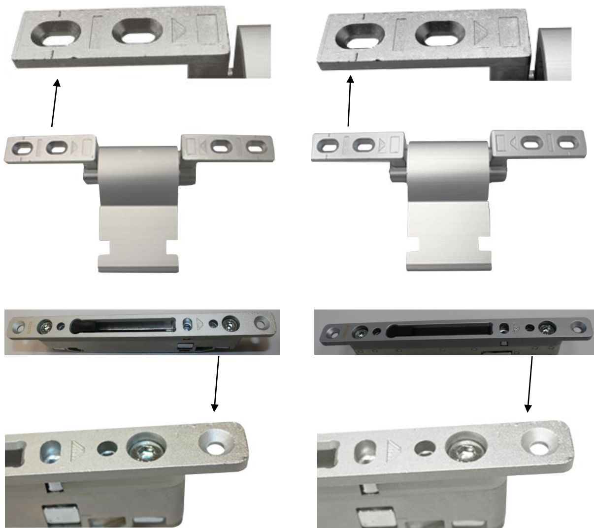
Nowy kolor R01.1 (2005170)