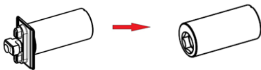
Rys. 2 Zmiana w zestawie 817052 -> 833202