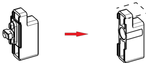
Rys. 3 Zmiana w zestawie 821509 -> 833201